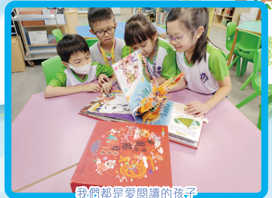
我們都是愛閱讀的孩子