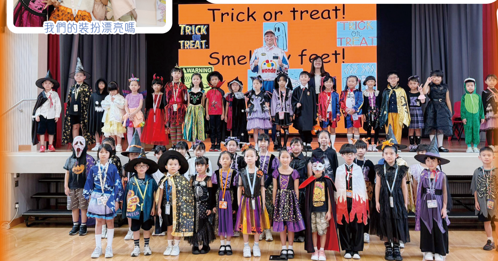
Trick or treat! 萬聖節快樂