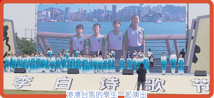
港澳台馬的學生一起演出