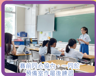
賽前同心協力，一同於預備室作最後練習

對於琚校辯論隊而言，這些成績不僅是一種肯定，更是一種鼓舞。未來，辯論隊將繼續努力，與大家一同勇往直前，迎接更多精彩挑戰！