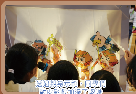
透過親身示範，同學們對皮影戲加深了認識