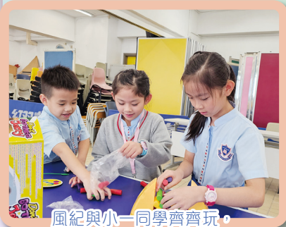
風紀與小一同學齊齊玩，大家都玩得不亦樂乎

此外，啟發潛能教育組透過 SCHOOL BUDDIES「伴你同行」計劃，支援及幫助一年級新生儘快投入並適應校園生活。本組定期安排參與計劃的風紀，於小息時跟一年級新生進行多元化的小組活動，既可以培養風紀的責任感和溝通技巧，也可以培養一年級新生的感恩之心。