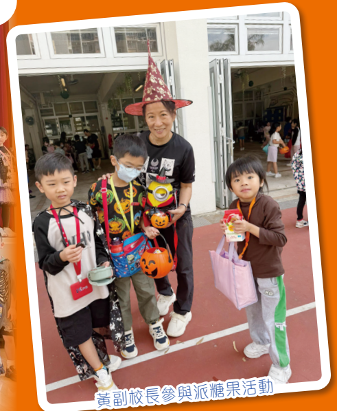
黃副校長參與派糖果活動