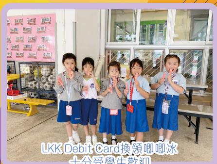
LKK Debit Card換領啣啣冰十分受學生歡迎

本年度的校本輔導獎勵活動引進新的電子系統(LKK Debit Card)，培養學生們的儲蓄習慣和學習正確的理財態度，讓他們因應個人喜好在不同的獎勵活動上使用積分。同時，設計不同類型的獎勵活動，如：「以終為始」訂立本年度個人目標（高年級爆谷、棉花糖派對），（低年級齊吃雪糕糯米糍）、讀讀「堅毅」文章。學生可以利用Debit Card的積分兌換心儀的禮物，例如：扭蛋、夾公仔、夾積木盒、啣啣冰、1月競投禮物。