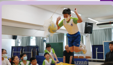
跳出舒適圈，享受完成任務的成功感

本校於2024年11月7日及8日為六年級學生舉辦團隊訓練歷奇活動。在導師的帶領下，同學完成不同的歷奇活動及團體遊戲，重頭戲是「沿繩下降」活動，同學在過程中體驗挑戰，從中尋找自我，不斷挑戰困難，超越自己的極限，活動能提升同學的積極性及競爭能力。