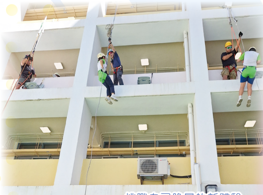
挑戰自己膽量的新體驗