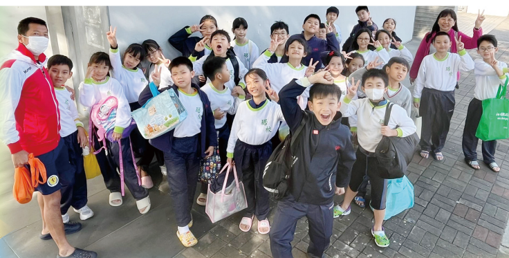
4C及4D到屏山天水圍游泳池進行游泳體驗課

本校體育科今年推出校本游泳體驗課程，讓同學探索游泳的樂趣，並學習基本技巧與安全知識。上學期，本校已安排四年級學生由體育科老師帶領到屏山天水圍游泳池上課。下學期，本校將安排三年級同學參與體驗，讓更多學生享受水中活動的快樂！