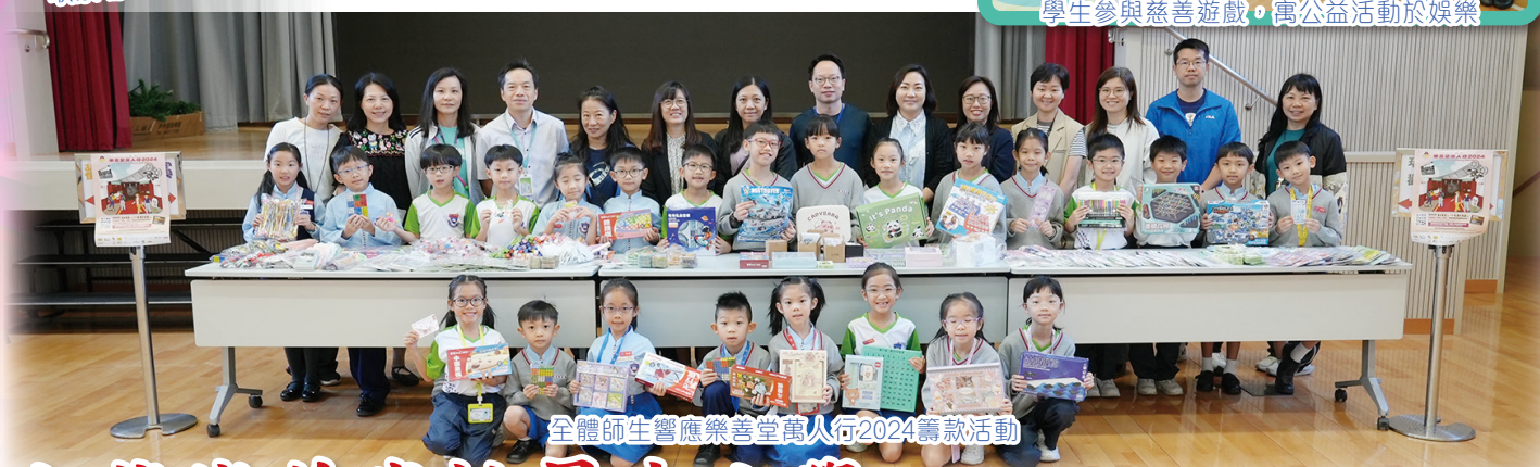
全體師生響應樂善堂萬人行2024籌款活動