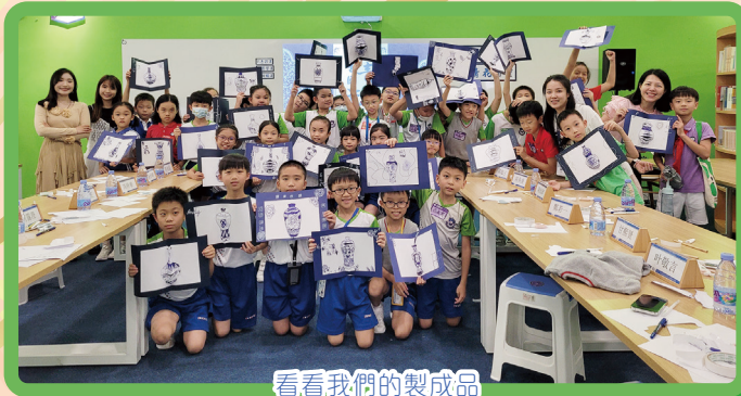
看看我們的製成品