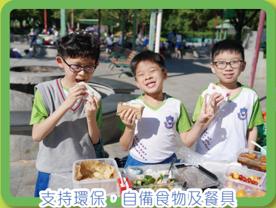
支持環保，自備食物及餐具