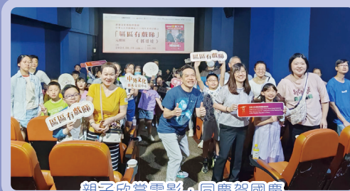
親子欣賞電影，同慶賀國慶