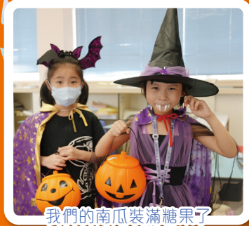
我們的南瓜裝滿糖果了