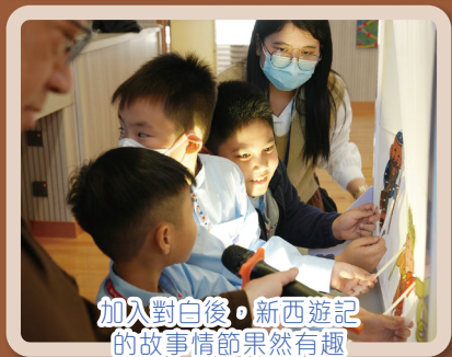
加入對白後，新西遊記的故事情節果然有趣