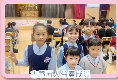
古箏五人合奏成員