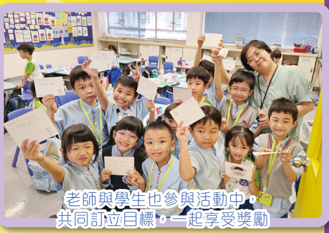
老師與學生也參與活動中，共同訂立目標，一起享受獎勵