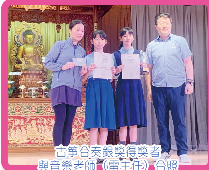
古箏合奏銀獎得獎者與音樂老師(雷主任)合照