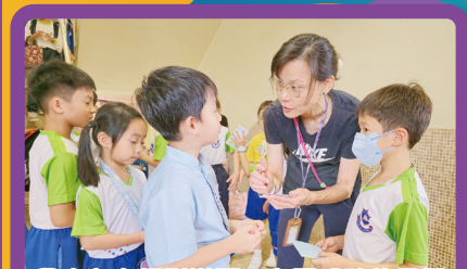
學生在老師引導下，有更明確的目標