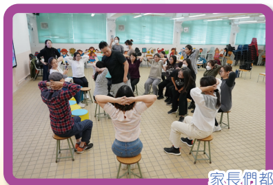
家長們都很用心上課