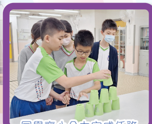
同學齊心合力完成任務