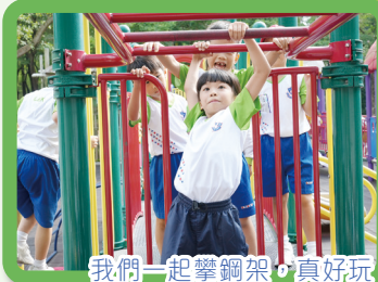
我們一起攀鋼架，真好玩