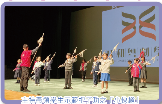
主持帶領學生示範把子功之「小快槍」