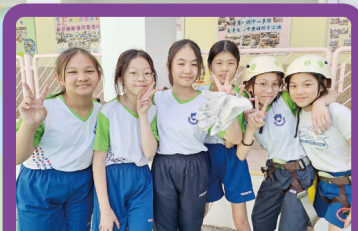
同學間互相扶持，友誼增進不少