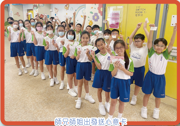
師兄師姐出發送心意卡