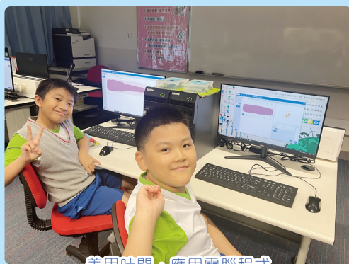
善用時間，應用電腦程式

本學年開始，琚校的時間表亦「大變身」，午膳前改以循環周上課，既能更靈活地安排課程，也讓學生有更多樣化的學習體驗。此外，為促進學生的全面發展，並幫助他們發掘自己的興趣和潛能，本學年琚校於十月至五月的星期一至三下午的導修時段，安排不同科目的聯課活動，或開放學校不同的場地供學生進行增潤活動。這個改革有助學生減輕學習的壓力，並且可以通過參加自己喜愛的活動來放鬆心情，好讓他們在學校獲得身心健康的發展。