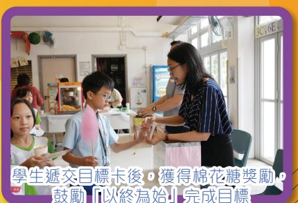
學生遞交目標卡後，獲得棉花糖獎勵，鼓勵「以終為始」完成目標