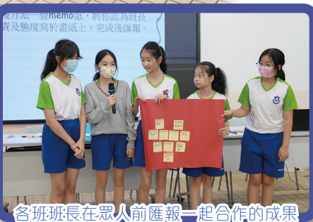
各班班長在眾人前匯報一起合作的成果

班長是具有領導潛能和班中認可的學生代表。訓輔組特意安排在2024年10月10日中午時段舉行班長訓練活動，目的是提升班長的個人品德及課室管理的能力。期望他們能學以致用，成為班房裡老師的小幫手。