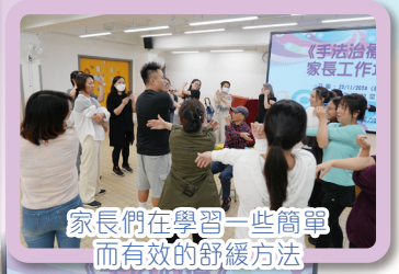
家長們在學習一些簡單而有效的舒緩方法