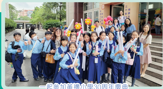
一起參加黃邊小學30周年慶典

翌日，我們一起參加30周年慶典，欣賞豐富多樣的表演節目。其中，我校更與黃邊小學一起表演朗誦《這才是少年應有的模樣》，為黃邊小學送上祝福。