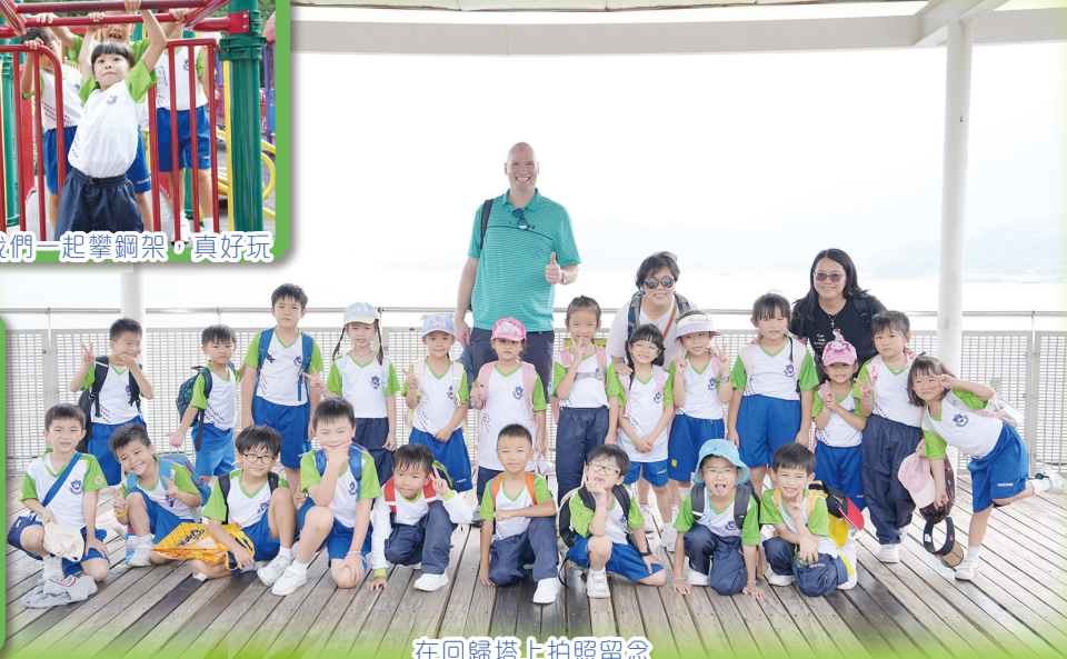
在回歸塔上拍照留念