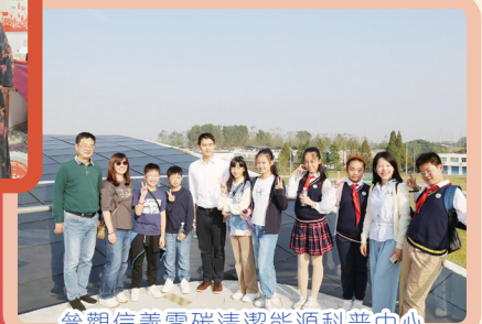
參觀信義零碳清潔能源科普中心