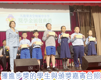
獲進步獎的學生與頒獎嘉賓合照