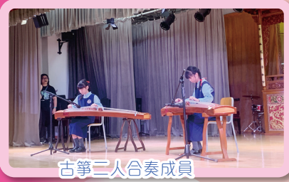
古箏三人合奏成員

2024年11月16日，本校同學參加由妙法寺劉金龍中學主辦「第七屆小學音樂邀請賽」，在眾多參賽者中，於合奏比賽項目中奪得1項銀獎及1項銅獎，實在可喜可賀。