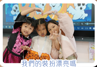
我們的裝扮漂亮嗎

萬聖節便服日活動已於10月30日小息期間舉行，當天同學們悉心打扮，向老師背誦萬聖節詩歌和取糖果。活動不但提升了學生對西方文化的了解，也大大增添他們學習英語的興趣。是次活動讓師生共渡了愉快的一天。