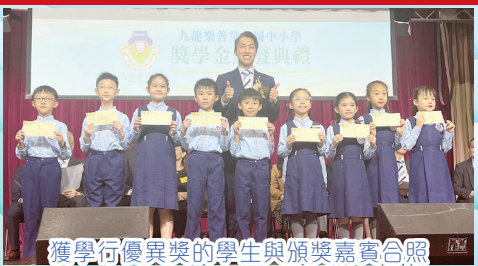
獲學行優異獎的學生與頒獎嘉賓合照

九龍樂善堂轄屬中小學獎學金頒發典禮已於11月10日假樂善堂王仲銘中學舉行。本校共有23位學生獲獎。當天有18位學生及23位家長出席。