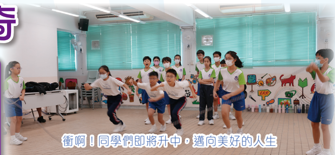
衝啊！同學們即將升中。邁向美好的人生