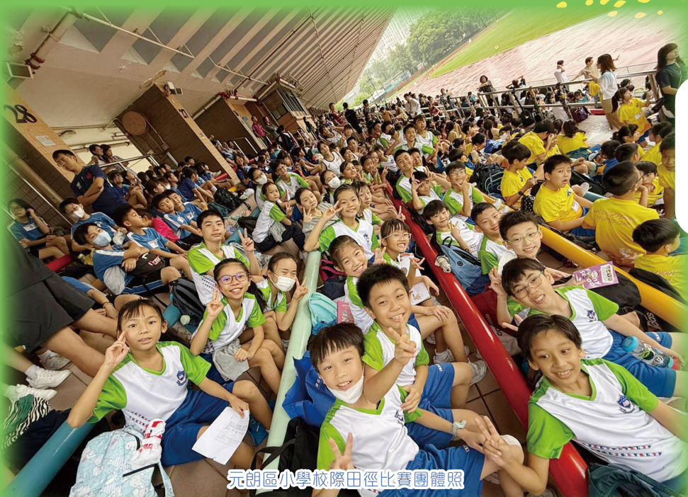
元朗區小學校際田徑比賽團體照

田徑組經歷刻苦的訓練後，於11月15日參加了「24-25年度元朗區小學校際田徑比賽」，並於個人項目獲得1亞、1季、1殿及4優的成績，而女子甲組更獲得團體獎第六名。