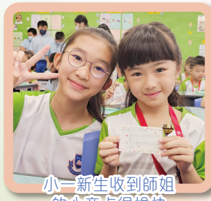
小一新生收到師姐的心意卡很愉快

本校啟發潛能教育組於開學日舉行了「師兄師姐齊迎新，一人一卡送新生」活動，全級六年級學生各寫一張心意卡，然後到一年級課室親手送給所有新生，藉此歡迎他們加入琚校這個大家庭，希望他們適應並享受琚校的校園生活。