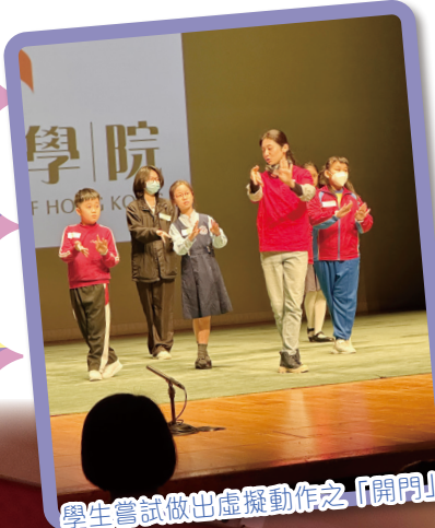
學生嘗試做出虛擬動作之「開門」

2024年11月22日上午9:30至下午1:00，本校六年級學生及老師共111人前往沙田大會堂演藝廳，參加由粵劇營運創新會舉辦的《粵劇學生專場2024》。當日有功架示範、專業導賞，更有精選折子戲演出，包括《三笑姻緣之求神》和《帝女花之香夭》，引領學生認識及感受中國音樂及傳統文化。