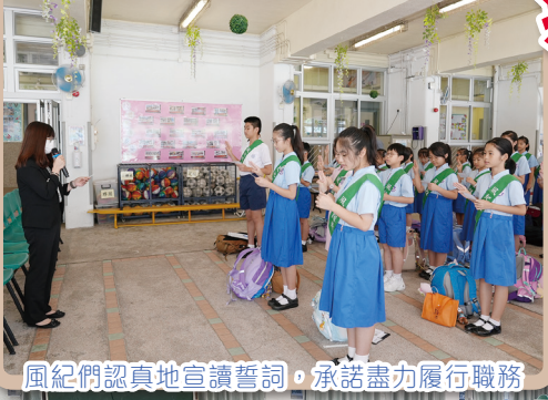
風紀們認真地宣讀誓詞，承諾盡力履行職務