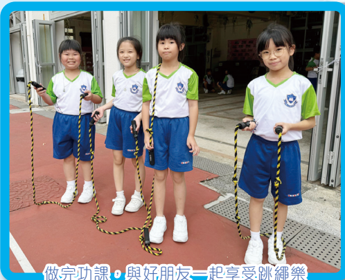
做完功課，與好朋友一起享受跳繩樂