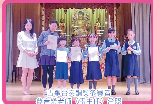
古箏合奏銅獎參賽者參音樂老師(雷主任)合照