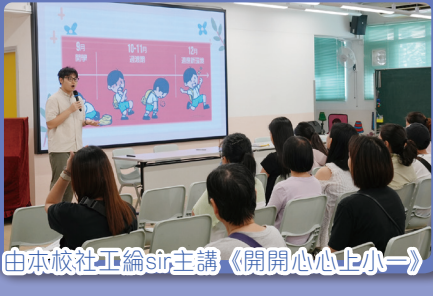
由本校社工綸sir主講《開開心心上小一》