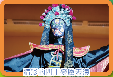
精彩的四川變臉表演