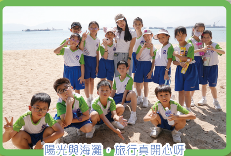
陽光與海灘，旅行真開心呀