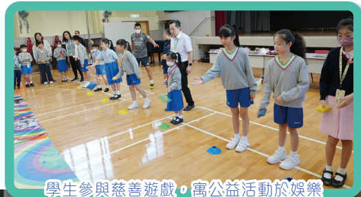
學生參與慈善遊戲，寓公益活動於娛樂