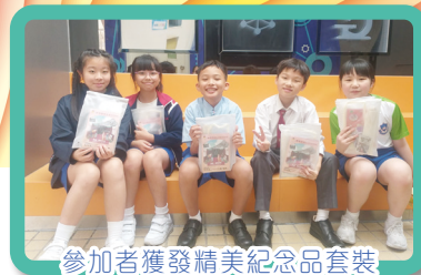
參加者獲發精美紀念品套裝

本校配合九龍樂善堂舉辦樂善堂萬人行2024籌款活動，已順利完成。其中「樂遊·探索」活動讓大家探索香港的電影取景場地，並透過籌款活動向社會傳遞正面的訊息。本校承蒙各家長踴躍捐輸，各學生積極參與，本活動籌得善款港幣26900元。此外，我們希望學生透過勸銷萬人行慈善優惠券活動，培養學生樂善好施的態度，關心社會上有需要的人，藉此發揮「萬人施萬人受，萬人共結萬人緣」的精神。