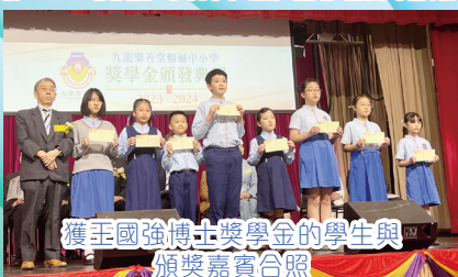
獲王國強博士獎學金的學生與頒獎嘉賓合照