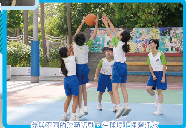
參與不同的球類活動，在球場上揮灑汗水