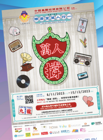
同學可以探索香港的電影取景場地，感受昔日情懷