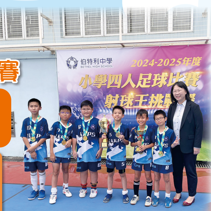
足球隊勇奪金盃組冠軍及「射球王挑戰賽」冠軍