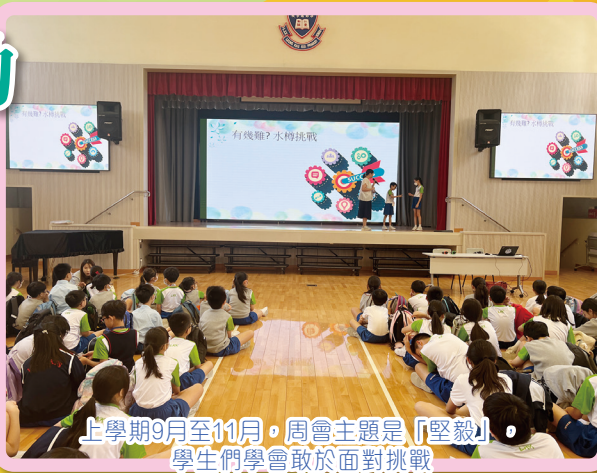
上學期9月至11月，周會主題是「堅毅」，學生們學會敢於面對挑戰

本學年，周會（逢星期四舉行）的內容以配合學生的品德培養為主，同時，加入「高效能人士的七個習慣」，例如：主動積極、以終為始、要事第一、不斷更新，除此之外，更加入四種首要的價值觀和態度（「堅毅」、「勤勞」、「尊重他人」、「同理心」），落實全人生命教育。