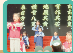
與黃邊小學一起表演朗誦《這才是少年應有的模樣》