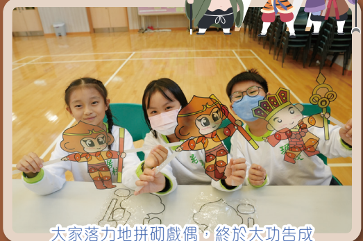
大家落地地拼砌戲偶，終於大功告成