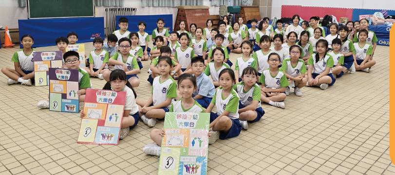
風紀們濟濟一堂，學習領袖才能

風紀訓練活動於2024年10月18日下午舉行，目的是提升風紀的個人意志及應變能力，並培養他們的團隊精神。透過參與不同形式的訓練活動，例如：團隊遊戲、文字遊戲、個人經驗分享、圖像分析、小組解難等，讓學生體會成為一隊關係密切的團隊，並在學校中更有效能地執行職務。