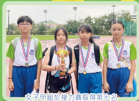
女子甲組於接力賽取得第七名