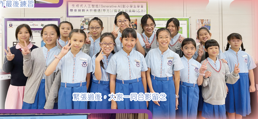
緊張過後，大家一同合影留念