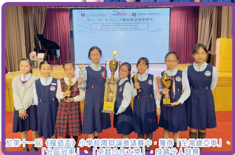
於第十一屆《耀道盃》小學校際辯論邀請賽中，獲得「全場總亞軍」、「分區冠軍」、「卓越合作大獎」，成績令人鼓舞