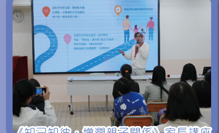
《知己知彼，增潤親子關係》家長講座