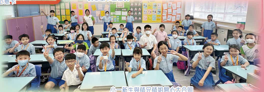
小一新生與師兄師姐開心大合照