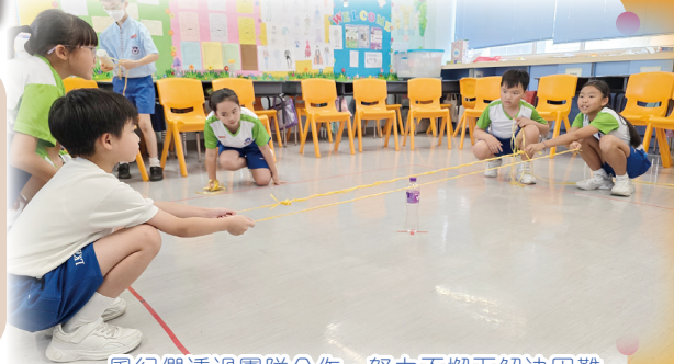
風紀們透過團隊合作，努力不懈解決困難

風紀於2024年9月27日宣誓就職，風紀們都認真聆聽陳校長的訓勉，承諾努力維持學校秩序、幫助學校建立良好校風，盡心服務同學。