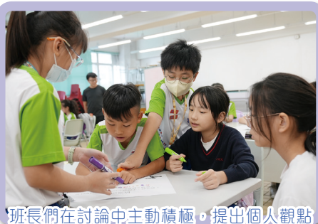
班長們在討論中主動積極，提出個人觀點